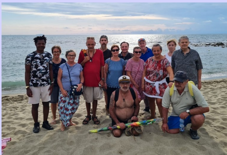
Gita a Marina di Pisa

Una piena ripresa e un ampliamento del campo d'azione e degli orizzonti, che ha richiesto energie e impegno, e il coraggio di lasciarsi alle spalle, nei limiti del possibile, il senso di precarietà e la quota di paura delle relazioni e di sfiducia che ci avevano accompagnati durante l'emergenza.